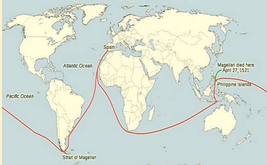
C. Harta – Călătoria lui Magellan

https://images.search.yahoo.com/search/images