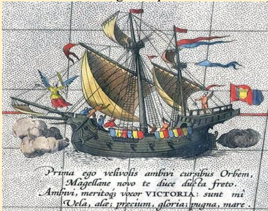
B. Corabia Victoria singura navă din expediția lui Magellan care s-a întors cu succes în Spania.