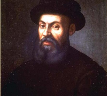
A. Fernando Magellan, navigator portughez, aflat în serviciul regelui Spaniei.